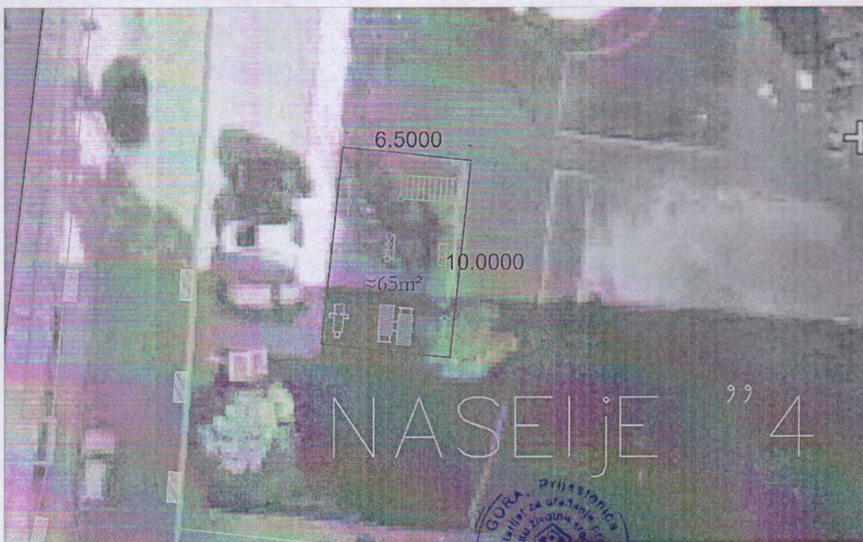
FOTODOKUMENTACIJA MOBILIJARA SPORTSKOG KARAKTERA