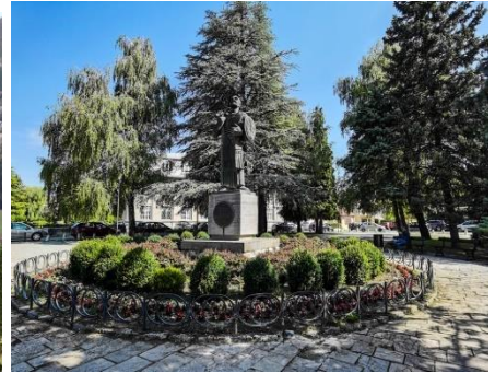
Plato kod Ivana Crnojevića