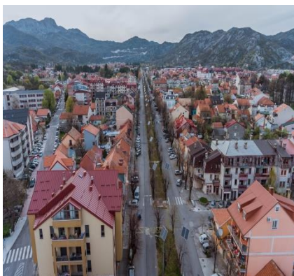
Bulevar crnogorskih junaka

Izbor projekata koji se finansiraju kroz Program razvoja obavlja se prema prioritetima građana koje lokalnoj upravi dostavljaju mjesne zajednice. Prioritet za gradnju daje se lokalnim i nekategorisanim putevima u onim mjesnim zajednicama u kojima se seoska domaćinstva bave poljoprivredom, voćarstvom, stočarstvom, pčelarstvom i drugim zanimanjima karakterističnim za ovdašnje predjele, kao i onima gdje postoji izraženo interesovanje građana za povratak na selo.