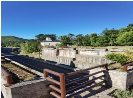
Podvožnja u jezgru grada