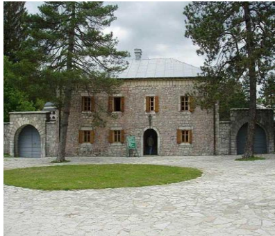
Plato ispred Biljarde