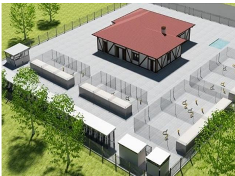
Azil za pse