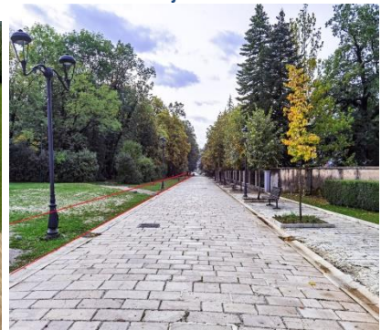
Trotoar ispred Rezidencije